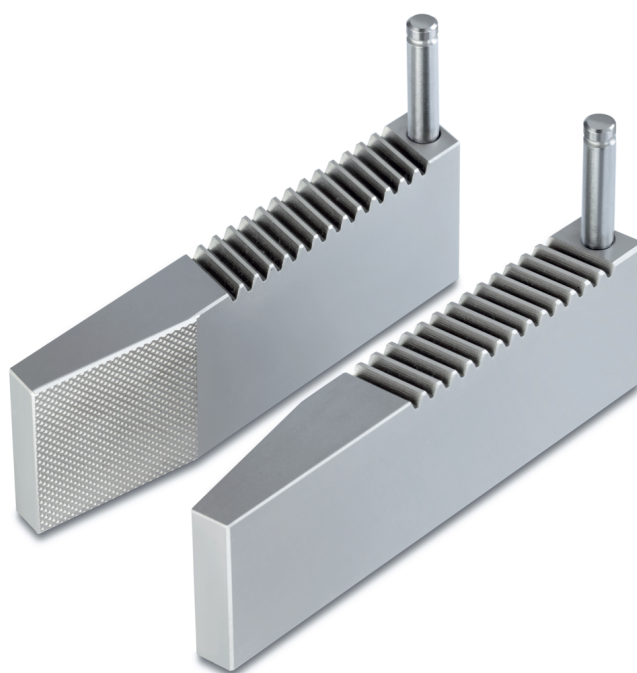
Mâchoire à grip pyramidal